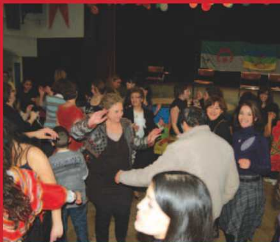
La fête au Wiesberg.