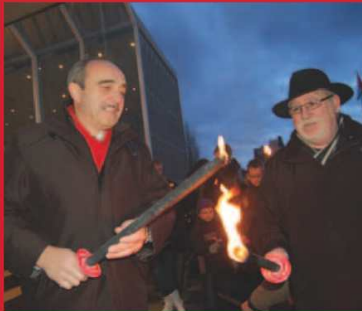
Les feux de la St-Jean au Creutzberg.