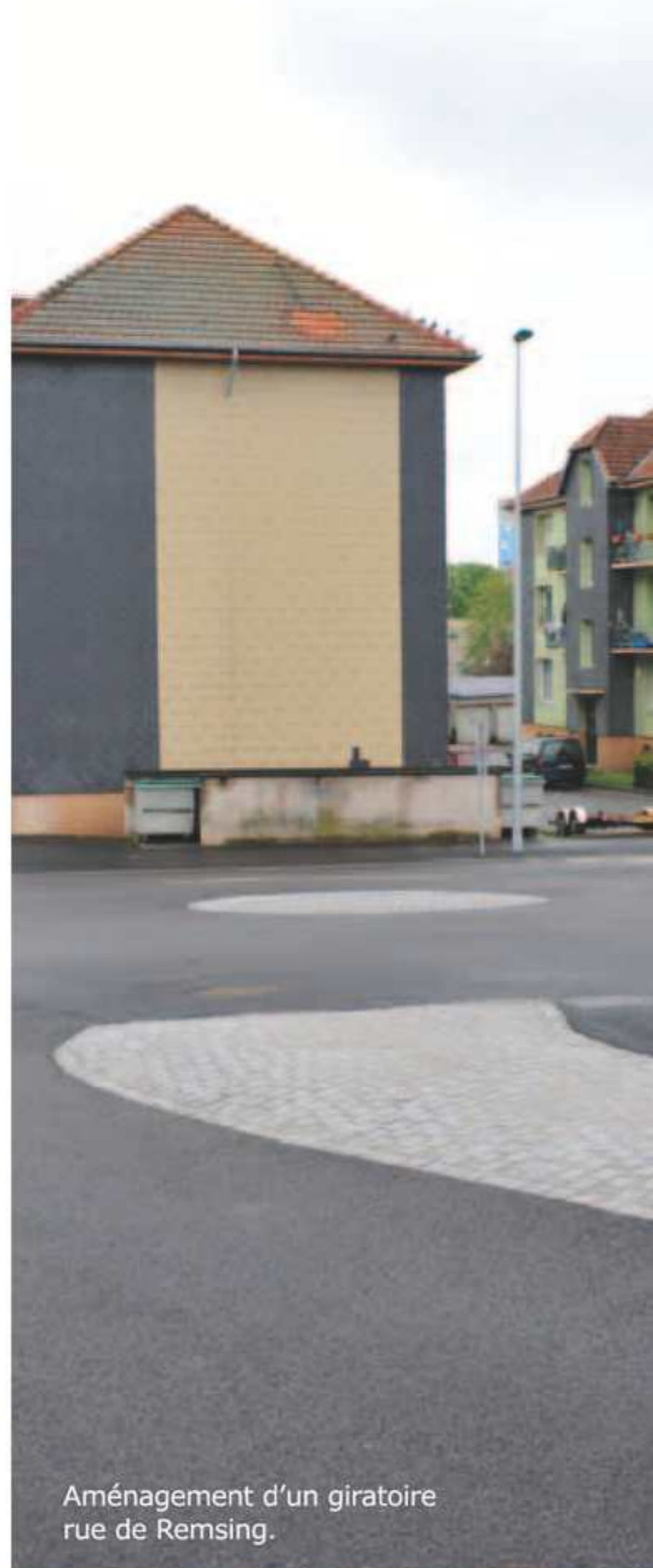
Aménagement d'un giratoire rue de Remsing.

* Association pour l'Accompagnement, le Mieux-être et le Logement des Isolés.