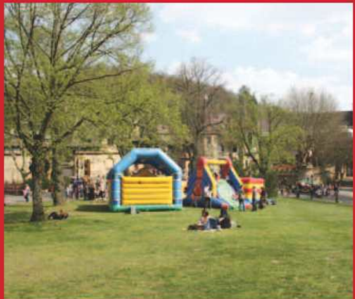
Pâques au Schlossberg.