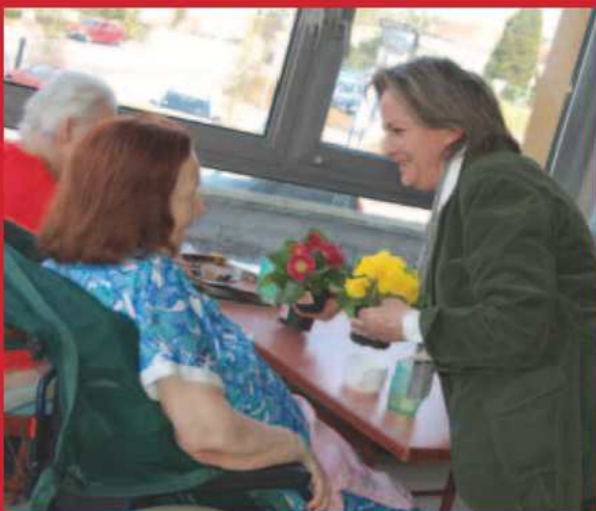
La distribution des primevères de la Ligue contre le Cancer aux personnes âgées.