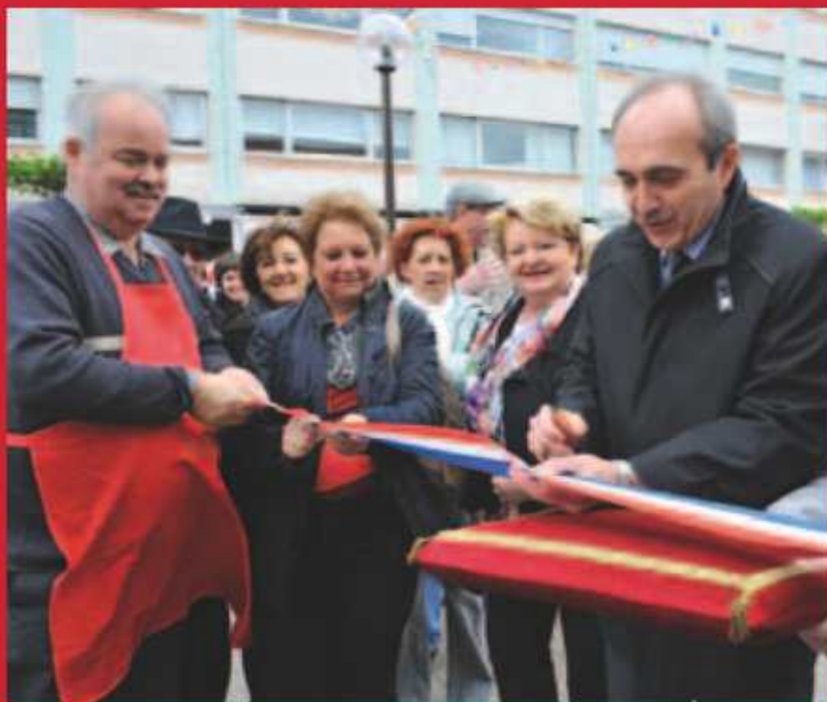
Le Marché des Saveurs tous les 1 ers mercredis du mois de 16h00 à 20h00, place Aristide Briand.