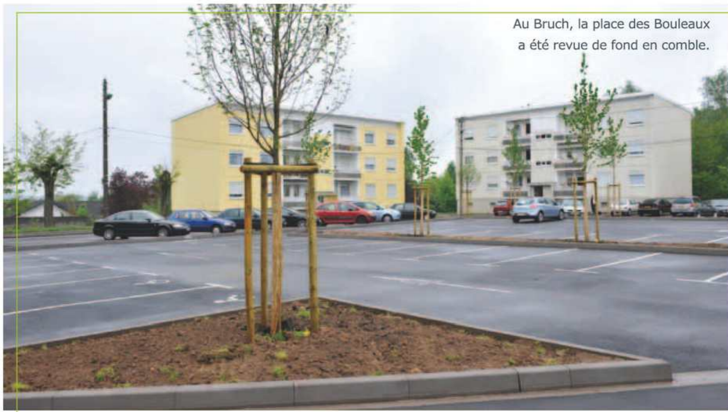
Au Bruch, la place des Bouleaux a été revue de fond en comble.

Apli* : les conditions de sécurité des ambulances en stationnement temporaire étant particulièrement précaires, trois emplacements équipés de bornes d'arrêt minute, ont été créés. « Ces places d'une largeur de 3,30 m, permettent aux handicapés de se mouvoir en toute sécurité. Afin d'éviter que des véhicules occupent de manière non autorisée ces emplacements, la durée de stationnement a été limitée à 20 minutes. Des capteurs intégrés dans la chaussée transmettent aux bornes l'heure d'arrivée du véhicule et déclenchent l'arrivée de la police municipale en cas de dépassement du délai », poursuit l'adjointe. ■■■■