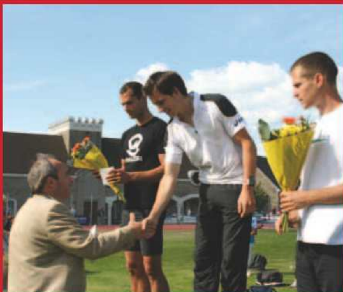
Le meeting d'athlétisme.