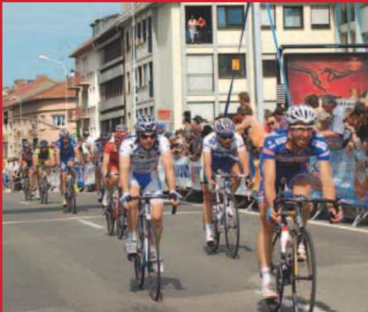
De nombreuses compétitions sportives.