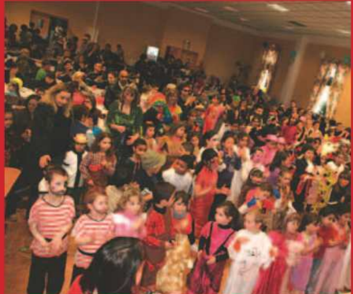
Le Carnaval des enfants à Marienau.