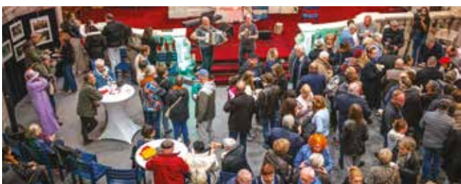
▲ Les Journées Culturelles Basques se sont déroulées du 24 au 26 octobre à la Syna avec chants, danses et animations thématiques.