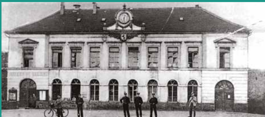
1843-1939 Mairie place de marche