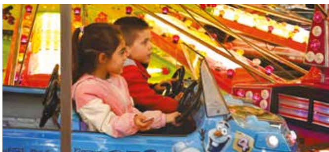
▲ La Kirb s'est tenue du 10 au 19 octobre sur le parking du Val d'Oeting.