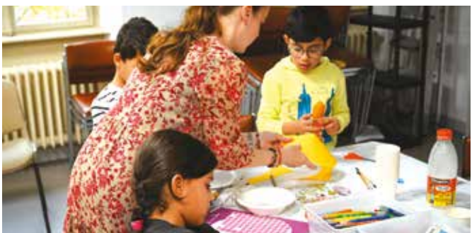
▲ Des activités du Passeport culturel ont été organisées au fil de la saison dans les structures de la ville.