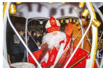
Les festivités de Noël se déroulent du 29 novembre au 23 décembre