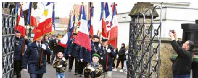
▲ La Ville a commémoré la Journée du 1 er novembre et l'Armistice du 11 novembre lors de temps de recueillement.