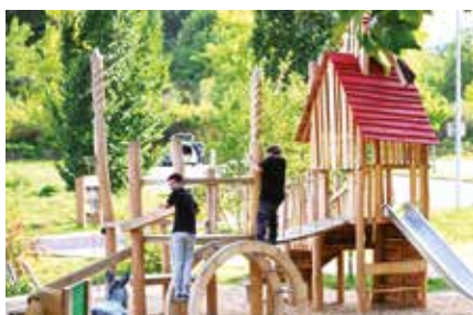
Trois espaces de sport et de loisirs aménagés