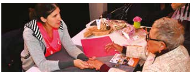
▲ Le 17 octobre, une soirée caritative s'est tenue à la Syna dans le cadre d'Octobre Rose, avec la remise d'un chèque à la Ligue contre le cancer.