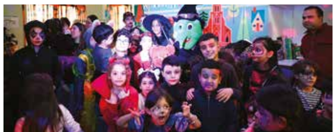
▲ Une animation Halloween a été proposée à la ludothèque pour les enfants et les familles.