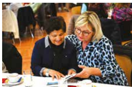
La semaine bleue a eu lieu du 6 au 10 octobre