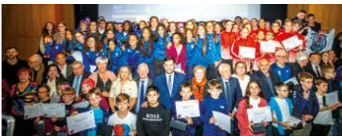
▲ La 4 e édition de la Nuit des Sports a eu lieu le 4 novembre au Centre Européen des Congrès du Burghof, avec la présentation des résultats sportifs de la saison.