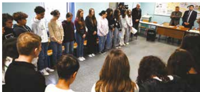
▲ Le 15 octobre, un temps de recueillement a eu lieu au collège Antoine Gapp, incluant une minute de silence et la lecture de la lettre de Jean Jaurès aux instituteurs.