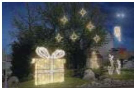
Forbach revêt à nouveau ses habits de fête