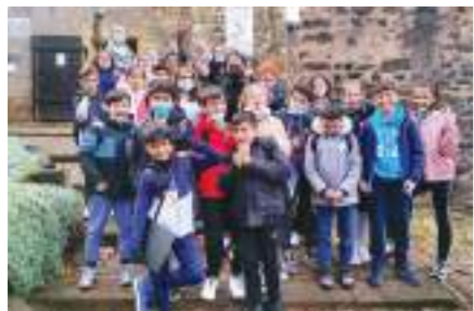
Sortie organisée par le Conseil Municipal des Jeunes