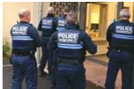
Police Municipale : doublement des effectifs