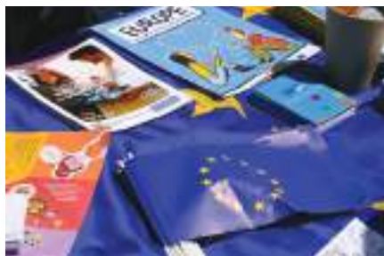
Semaine de l'Europe : les enfants se dé-pensent au stade du Schlossberg