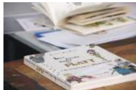
Cinquante auteurs attendus au 1 er Salon du Livre de Forbach les 11 et 12 juin prochains.